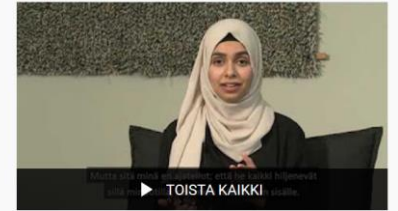
Arvostavat aamukahvit - työyhteisöt monimuotoisuuden edistäjinä